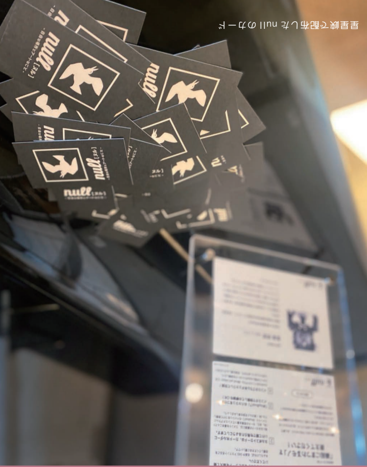
星里峡で配布したnullのカード

確認してください。 裏表紙のQRコードより 開催の予定など、詳細は 過去のnullの様子や次回 の回となりました。